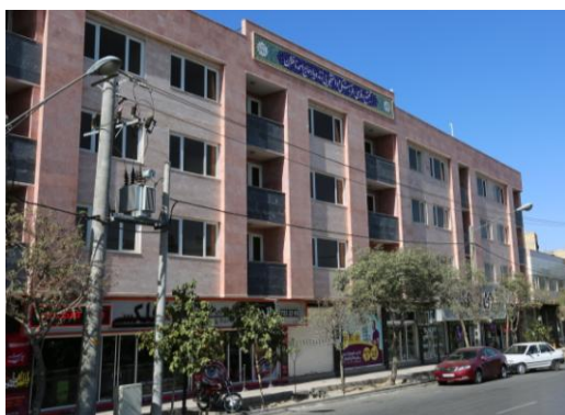
مجتمع خوابگاهی مرحوم ناظران